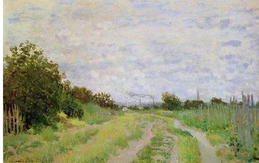
Chemin dans les vignes