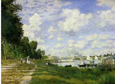
Le Bassin d'Argenteuil

Galerias Nationales au Grand Palais à Paris jusqu'au 24 janvier 2011